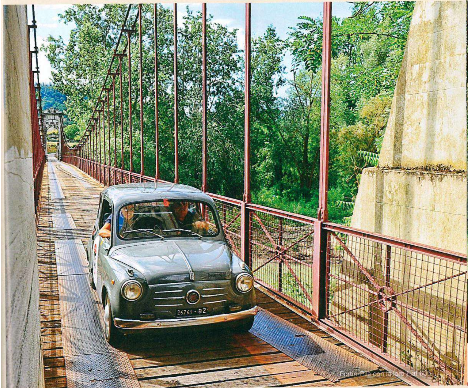
Fortin-Pilè con la loro Fiat 600.